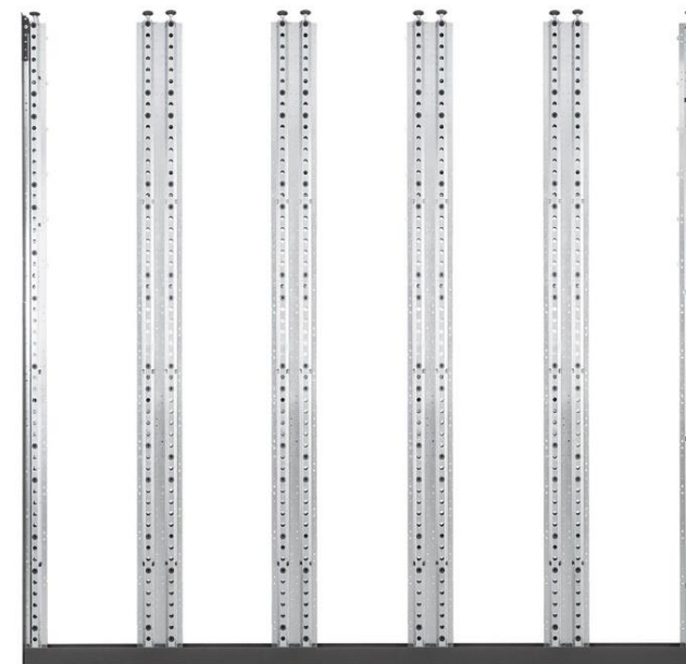
Layout / Schema di posa