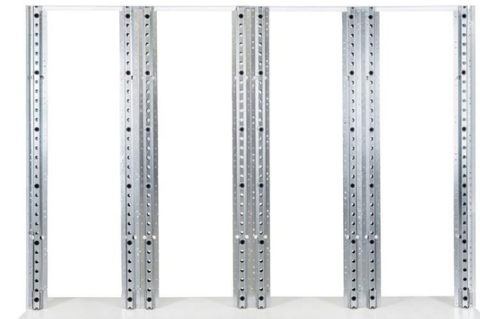
Layout / Schema di posa