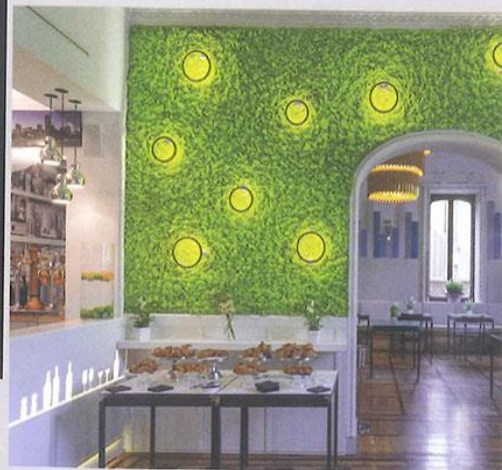
Hotel Villa vela-MOSSwall-Arch.Isacco Brioschi