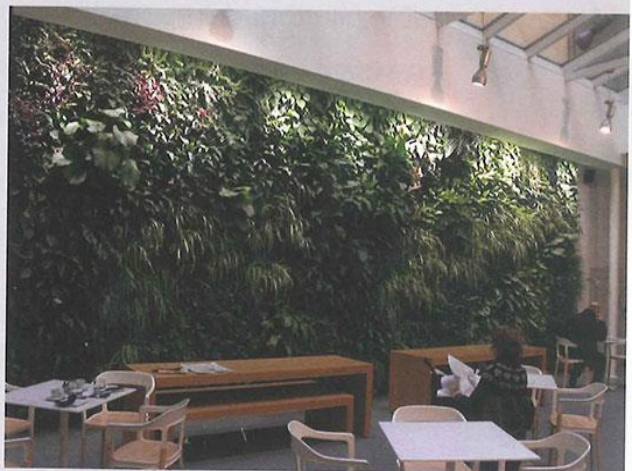
libreria- fandango - Roma- Giardino Verticale

Verde Profilo Srl Usmate Velate (MB) www.verdeprofilo.com